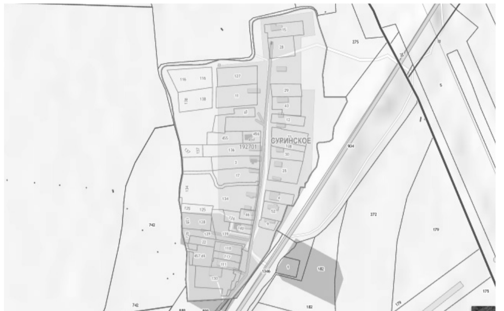
Схема границ территории планирования